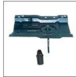
Wspornik metalowy siedziska kpl. T- 173