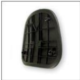
Wkład oparcia M-148