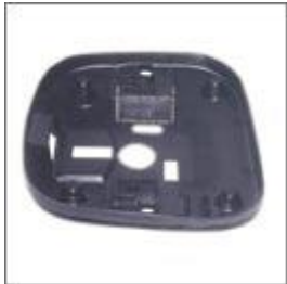
Maskownica siedziska M-103