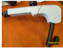
T-181 Kompletny mechanizm CPT