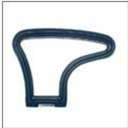
Podłokietnik I M-104