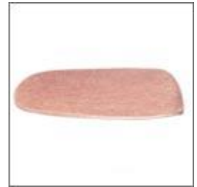
Wkład siedziska skl. pod M-103 T - 191