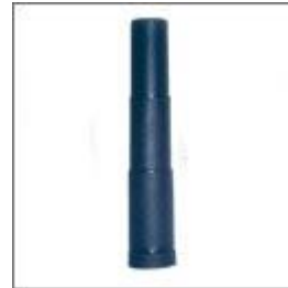
Maskownica teleskopowa kolumny gazowej 3 części. M-01