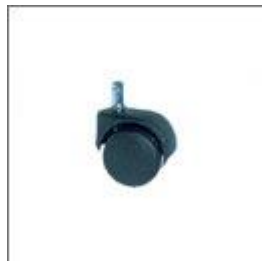
Kółko jezdne fi 50/11 T-177 czarne/T-176 szare