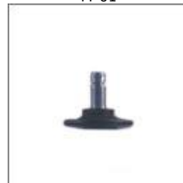
Stopka fi 11 M-26

Plastikowe części krzeseł są dostępne w kol. Czarnym i szarym RAL7035