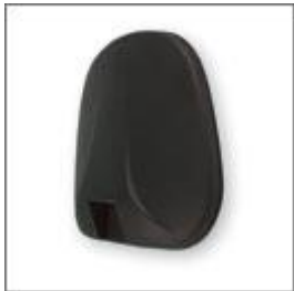
Maskownica oparcia M-147