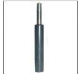
Kolumna pneumatyczna L 235mm T- 184