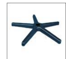
Podstawa krzesła fi 580/50/11 M - 29