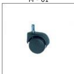
T-177 Kółko czarne 50/11