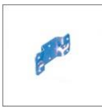
Uchwyt oparcia M-06 /I