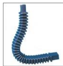
Maskownica listwy oparcia (wspornika) M - 59