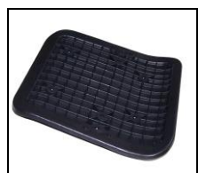
Wkład siedziska plastik M-151