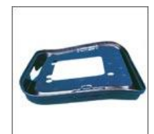
Maskownica siedziska M - 146