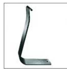
Listwa (wspornik) oparcia T-185