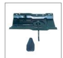
Wspornik siedziska kpl. T-173