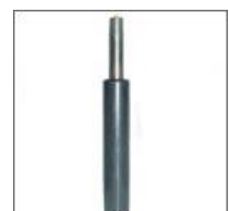
Kolumna pneumatyczna L 235/50 T-184