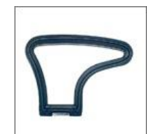
Podłokietnik II M - 104