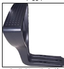
Podłokietnik Golf M-164