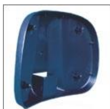
Maskownica oparcia M - 145