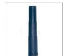
Maskownica teleskopowa kolumny gazowej M - 01