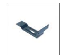
Wspornik podłokietnika M - 109