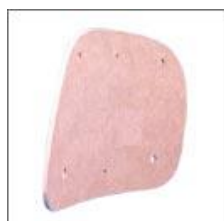
Wkład oparcia sklejka T-182