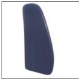
Maskownica oparcia M - 27