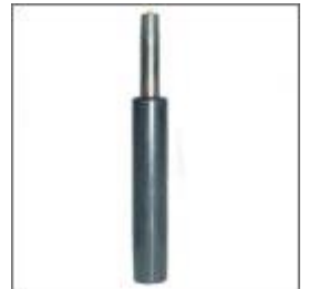
Kolumna pneumatyczna L 235mm fi 50 T - 184

Plastikowe części są dostępne w kolorze RAL 7035 szarym