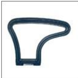
Podłokietnik I M-104