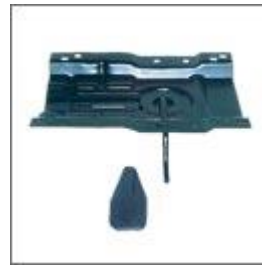
Wspornik metalowy siedziska- kpl.T-173