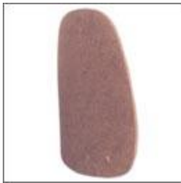
Wkład oparcia sklejka T-174