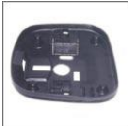
Maskownica siedziska M-103