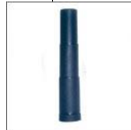
Maskownica teleskopowa kolumny gazowej 3 części. M-01