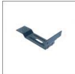
Wspornik podłokietnika T-M109