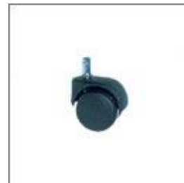
Kółko jezdne szare T - 176