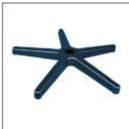
Podstawa fi 580/50/11 M-29

Plastikowe części są dostępne w kolorze RAL 7035 szarym