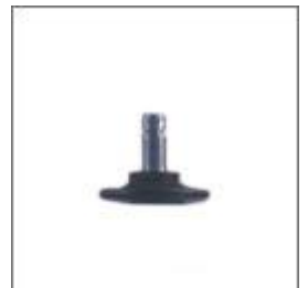
Stopka fi 11 M-26